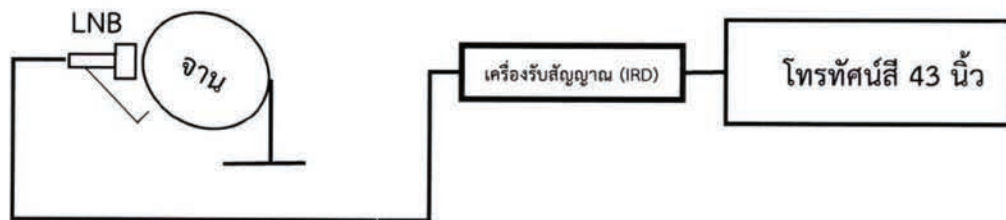
ภาพประกอบการติดตั้งจานดาวเทียม กลุ่มที่ 1