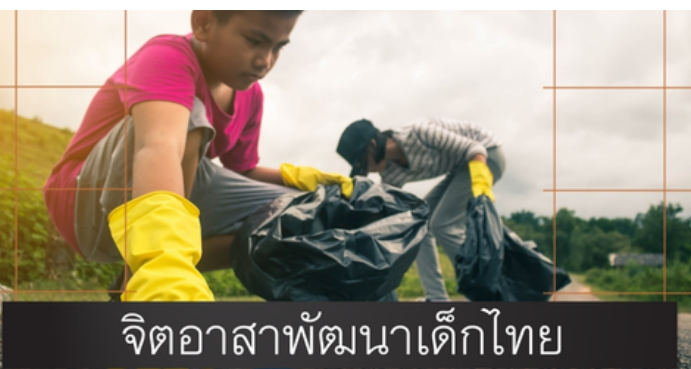
จิตอาสาพัฒนาเด็กไทย