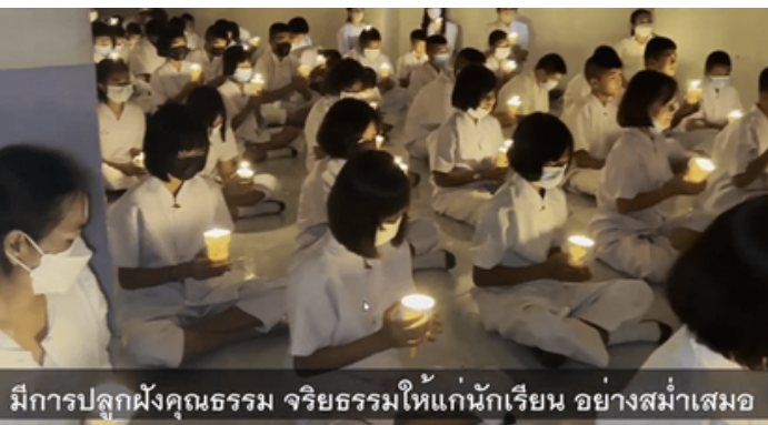
มีการปลูกฝังคุณธรรม จริยธรรมให้แก่นักเรียน อย่างสม่ำเสมอ