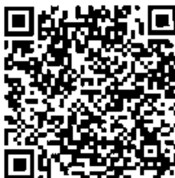
QR Code แบบตอบรับ

หมายเหตุ : ส่งแบบตอบรับภายในวันที่ ๒๖ เมษายน ๒๕๖๖